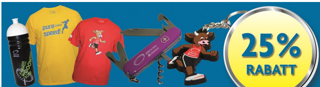
Cooler, 'Cooly' und andere Fanartikel